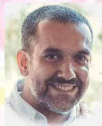
Auxiliar Administrativo Encargado de la coordinación de cargas, logística.