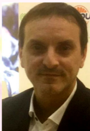
Jefe Operativo Logística y Asesor comercial, nexo entre la Gerencia Comercial y Operaciones.