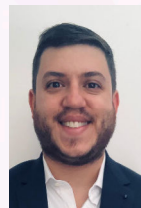
Auxiliar Administrativo Colabora en la coordinación de cargas.